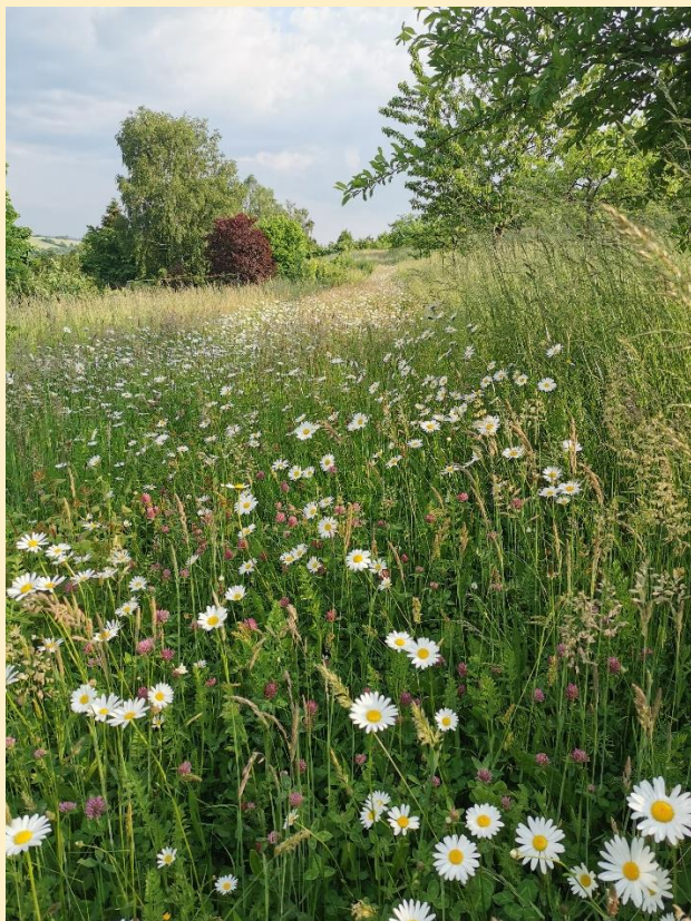
Blühstreifen im Obstsortengarten im Juni 2021