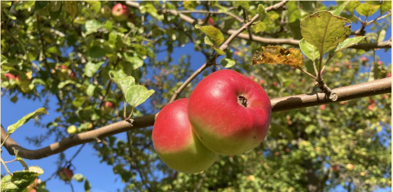
Früchte des Lausitzer Nelkenapfels an einem Altbaum im Obstsortengarten der Oberlausitz in Ostritz - Leuba