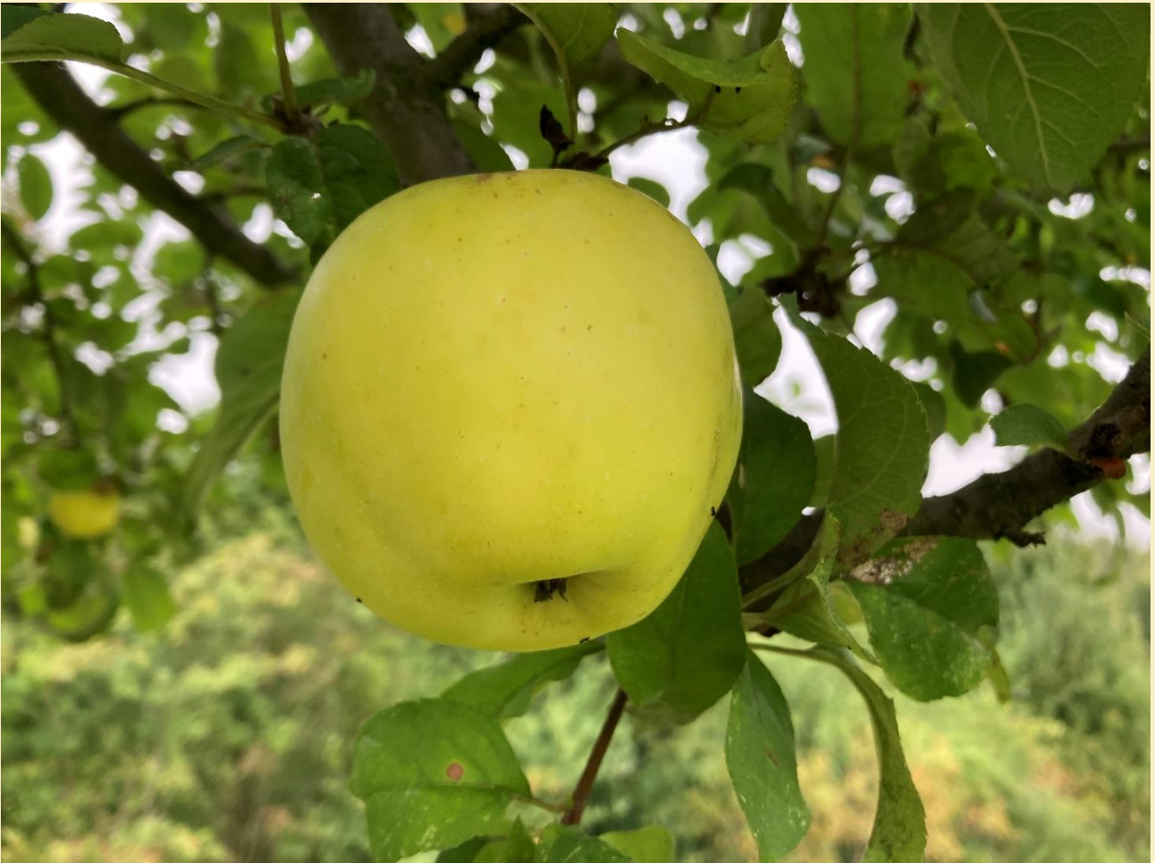
Seestermüher Zitronenapfel im Obstsortengarten der Oberlausitz in Ostritz-Leuba